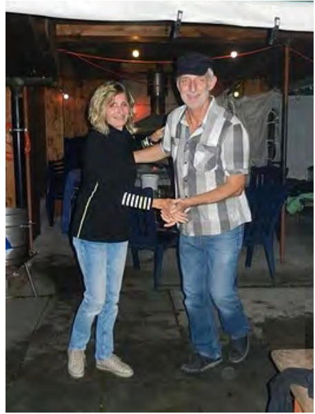
Trotz geringer Teilnahme eine tolle Stimmung an unserer Abschiedete.