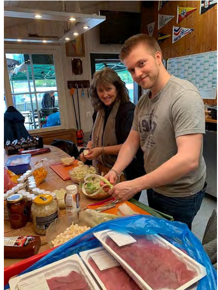
Unsere fleissigen Helfer in der Küche und beim Zeltaufbau.