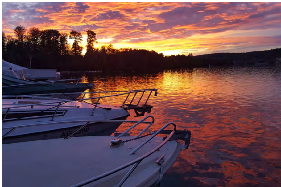
Romantische Abendstimmung am Rhein