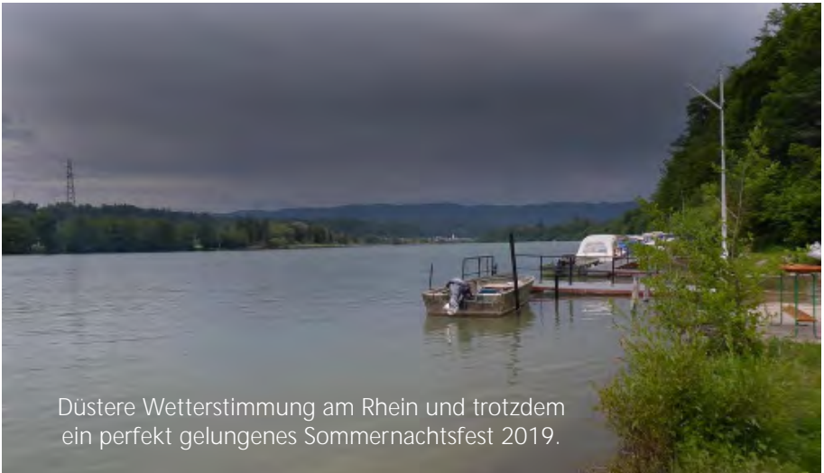
Düstere Wetterstimmung am Rhein und trotzdem ein perfekt gelungenes Sommernachtsfest 2019.