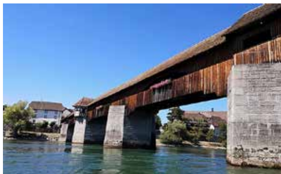
Alte Holzbrücke bei Bad Säcking

Wegen der ausgebauten Fahrrinne und der jahreszeitlich ziemlich regelmässigen Niederschläge in seinem Einzugsgebiet ist der Rhein heute von der Mündung bis zum Hafen Rheinfelden weitgehend problemlos ganzjährig schiffbar. Oberhalb des Rheinfalls ist der Rhein bis zur Brücke bei Neuhausen am Rheinfall für jeden Schiffsverkehr gesperrt. Von der Rheinbrücke in Schaffhausen bis nach Konstanz besteht in den Sommermonaten eine durchgehende Schiffsverbindung. Das Stauwehr in Schaffhausen sorgt in diesem Bereich für einen gleichbleibenden Wasserstand bis Diesenhofen. Da die dortige Brücke sehr niedrig ist, senken manche Schiffe für die Durchfahrt ihr Steuerhaus ab. Flussaufwärts von Stein am Rhein ist der Rhein nicht reguliert, daher je nach Wasserstand schiffbar.