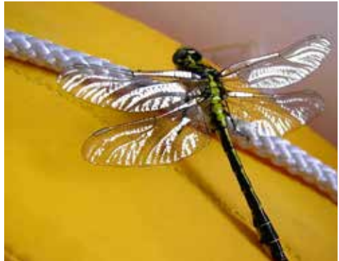
Eine Libelle sonnt sich an Bord

Der Rhein ist vom Bodensee bis zu seiner Mündung ein wichtiges Rast- und Überwinterungsgebiet für viele Vogelarten. Die wichtigsten Arten sind: Blässhühner, Blässhgänse, Schwäne, Stockenten, Reiher, Haubentaucher und Kormorane.