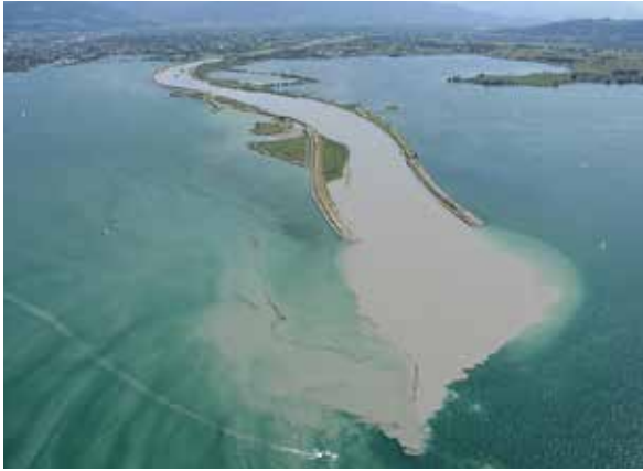
Rheinmündung in den Bodensee

Im Bodensee bildet das Wasser zunächst eine grau-grüne Oberfläche, die sich dann aber zum Seeboden absenkt.