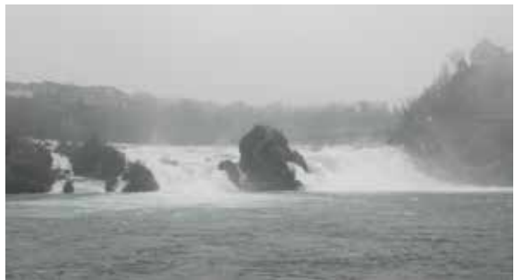
Der Rheinfall bei Schaffhausen

Der Hochrhein weist zahlreiche Staustufen auf und auf seinen wenigen natürlichen Abschnitten befinden sich mehrerer Stromschnellen. Bei Koblenz mündet die Aare von Süden her in den Rhein. Im Gegensatz zum Rhein hat die Aare, die zwar kürzer ist als der Rhein,