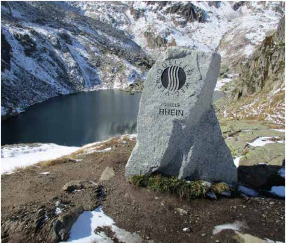
Die Quelle des Rheins beim Tomasee im Kanton Graubünden

Rhenus Pater „Vater Rhein“ verehrt. Der Rhein selbst ist auch Namensgeber für das im Jahre 1925 entdeckte chemische Element Rhenium. Der Hinterrhein, mit einer Länge von 64 km fließt zunächst ostnordöstlich, dann nach Norden. Seine Quellbäche liegen in den Adula-Alpen. Der 75 Km lange Vorderrhein, der im Tomasee entspringt, fließt in ostnordöstlicher Richtung. Ihm fließen von Süden her teils ebenbürtige Nebenflüsse zu. Der Vorder- und Hinterrhein vereinigen sich bei Tamins-Reichenau zum Alpenrhein. Auf einer Länge von 86 Kilometern fällt er von 599 Metern auf eine Höhe von 396 Metern über Meer ab.