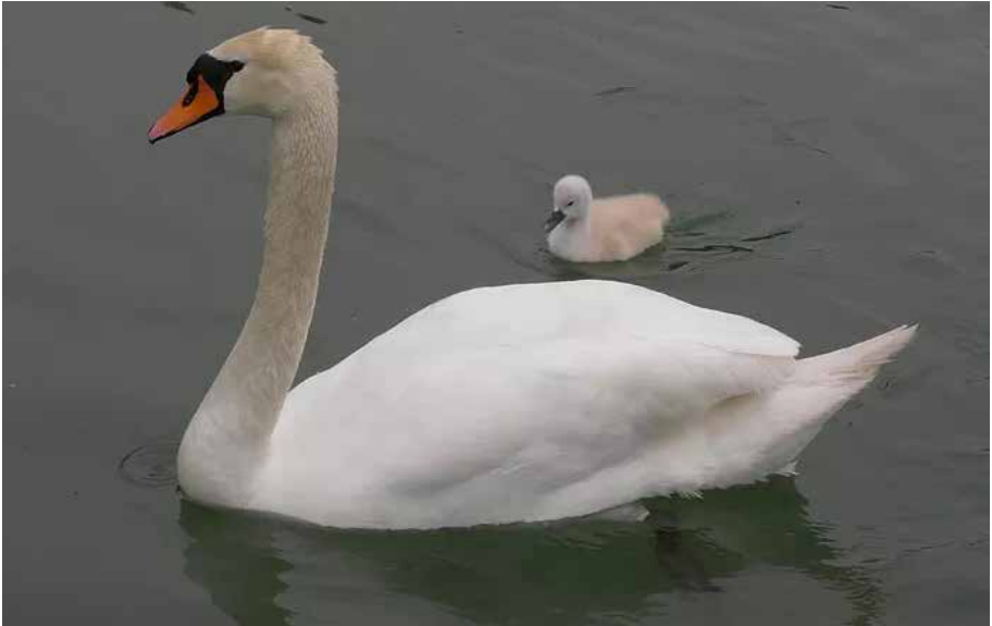
Ein Bewohner des Rheins mit seinem Nachwuchs