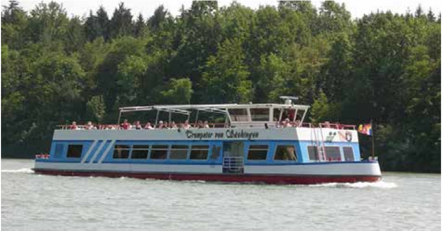
Der Trompeter von Säckingen

Wir dürfen uns glücklich schätzen, einen der schönsten Abschnitte des Rheins nutzen zu dürfen. Auf einem Rheinabschnitt, ohne grosse Frachtschiffe und moderne Personenschiffe geniessen wir die Ruhe und Idylle der Natur. Eine kleine Ausnahme, was die Personenschiffe betrifft, ist der Trompeter von Säckingen, mit seinem Heimathafen in Bad Säckingen, der uns jedoch nicht im Geringsten stört. Im Gegenteil sogar, es ist schön zu sehen, wie der „Trompeter“ gemächlich an uns vorbeizieht.