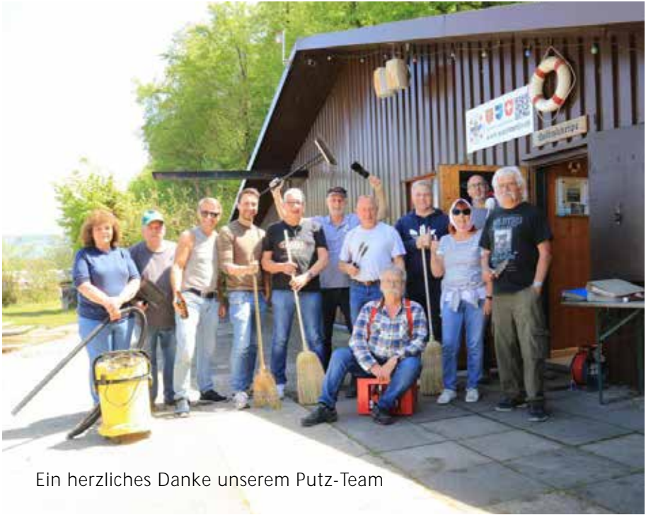
Ein herzliches Danke unserem Putz-Team