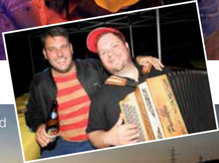
Gemütliche Stimmung am Abend