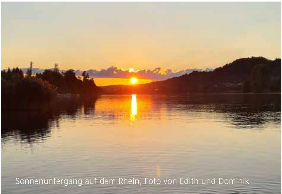
Sonnenuntergang auf dem Rhein