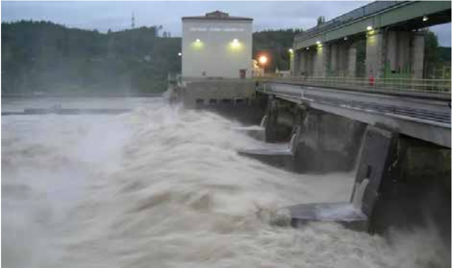
Kraftwerk Ryburg-Schwörstadt bei extremem Wasserabfluss

besonders in den Regionen Köln, Düsseldorf und dem Ruhrgebiet. Eine der wichtigsten Hafenstädte etwas nördlicher am Rhein gelegen ist Duisburg mit dem grössten Binnenhafen Europas. Etwas weiter Flussabwärts befindet sich zwischen Emmerich und Kleve, mit einer Länge von mehr als 400 Metern, die längste Hängebrücke Deutschlands. Nordwestlich von Emmerich erreicht der Rhein die Holländische Grenze. Dort beginnt auch das Rhein-Maas-Delta, ein bedeutendes und von der Natur geprägtes Gebiet der Niederlande. Bei Millingen am Rhein fließt der Rhein in die Waal mit zwei Drittel seines mittleren Abflusses. Ein Drittel fließt in den Nederrijn, der sich vor Arnhem teilt und ca. ein Drittel in die Isse fließt. So bilden sich drei Hauptstromverläufe, von denen die Waal der Hauptstrom bildet und ihr auch die Stromkilometrierung folgt.