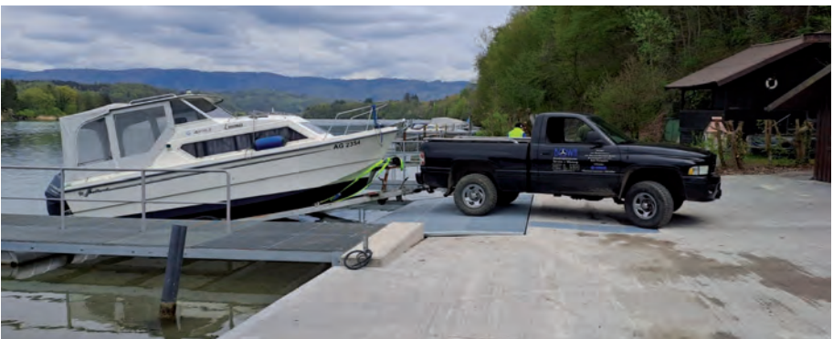
Erste Belastungsprobe am 26. April